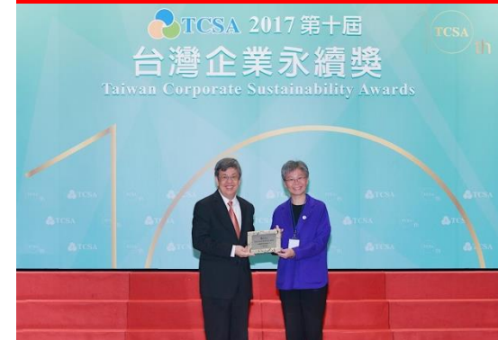
2017 台灣企業永續獎 七大獎