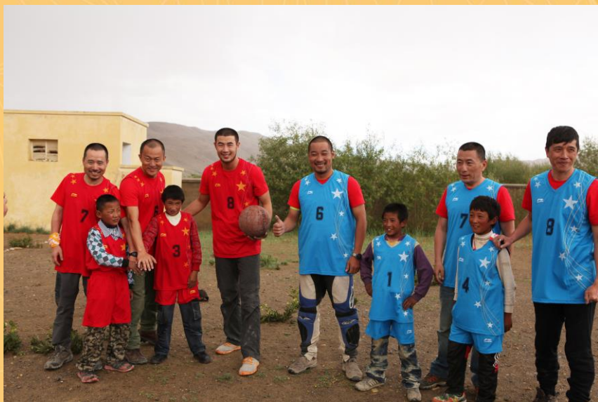
2012为西藏阿里札达县达巴 乡村办小学