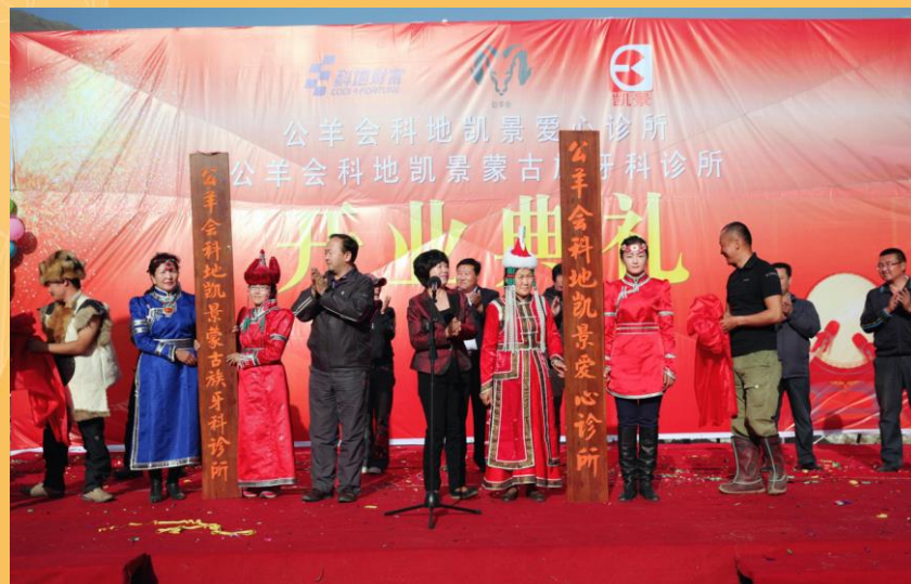
2013年和静县克尔克提乡捐 建“公羊会爱心诊所”