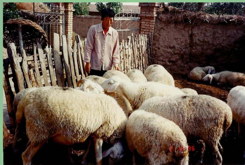
扶持妇女养羊项目

与妇女发展相结合是协会小额贷款生命力所在。小额贷款是因扶持妇女发展而产生，妇女发展是妇联的核心工作，两者相互促进、共同发展。如果离开了扶贫与妇女发展，协会小额贷款就失去了存在的价值。