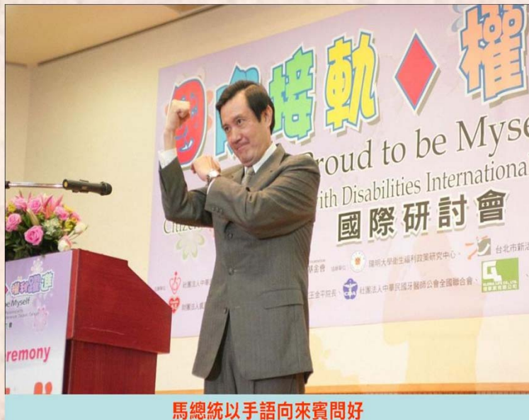
馬總統以手語向來賓問好